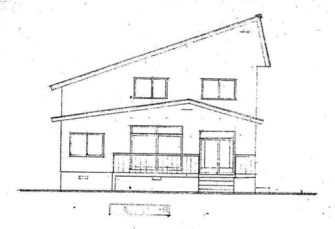
Left Elevation without entrance Extension and 2nd Floor side verandah additions.